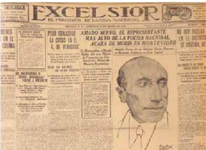
Portada del 25 de mayo de 1919. Murió Nervo.