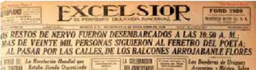
Portada del 12 de noviembre de 1919. Luto colectivo.

Su cuerpo embalsamado arribó a Veracruz.