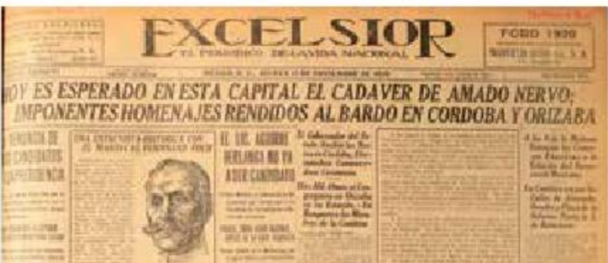
Portada del 13 de noviembre de 1919. Tributo social.

Más de 20 mil personas siguieron el féretro.