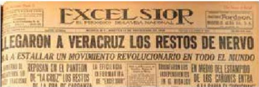
Portada del 11 de noviembre de 1919. Llegó a México.

El dibujo de portada es obra de El Chango Cabral.