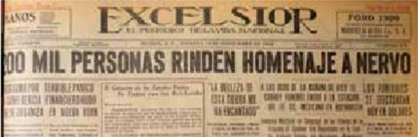
Portada del 14 de noviembre de 1919. Apoteósico.

Imponentes homenajes en Córdoba y Orizaba.