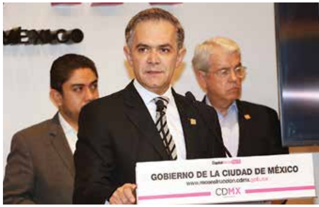
El jefe de Gobierno, Miguel Ángel Mancera, señaló que 46 mil documentos se subieron a una plataforma y podrán consultarse.

POR ARTURO PÁRAMO arturo.paramo@gimm.com.mx